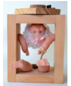
Die-in-sich-Gekehrte Holz, Fundstücke; Reiner Seibold 1997 © Museum der Dt. Spielzeugindustrie

Eine besondere Stellung in seinem Gesamtchaffen stellen seine „Kastenmänner“ dar. Dies sind Satiren aus Holz, sie gehen von der Doppeldeutigkeit vieler deutscher Worte aus und der Freude am Wortspiel. Seibold kombiniert die strengen, grafischen, kastenartigen Formen der Körper mit allerlei Krimskrams, Nippes, Fundstücken und Collagen. So in einen neuen Sinnzusammenhang gesetzt, ergeben sie Figuren, die mit Hilfe des jeweiligen Textes „gelesen“ werden können.